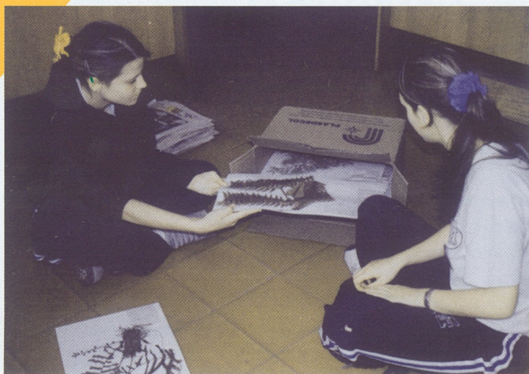
CNEMIDRANIA HORRIDA: especie en vía de extinción hallada en el Colegio

El proyecto BIOMARY es la primera etapa de un gran sueño llamado "El Agua como Herramienta Pedagógica" que tiene como objetivo final generar cultura ambiental, usando los recursos de los que disponemos de la mejor manera posible.